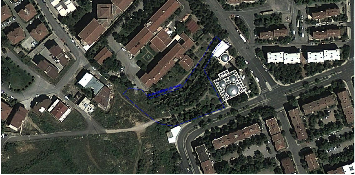
Şekil 1: Plan Değişikliği Sınırlarını Gösterir Planlama Alanının Konumu

Planlama alanı, Bursa İli, Yıldırım İlçesi, Değirmenlikızık Mahallesi sınırları dâhilinde bulunmaktadır. Kaplıyakaya Camii batısında ve Huzurevi güneyinde kalmakta olan alan, Kanuni Caddesinden cephe almaktadır.