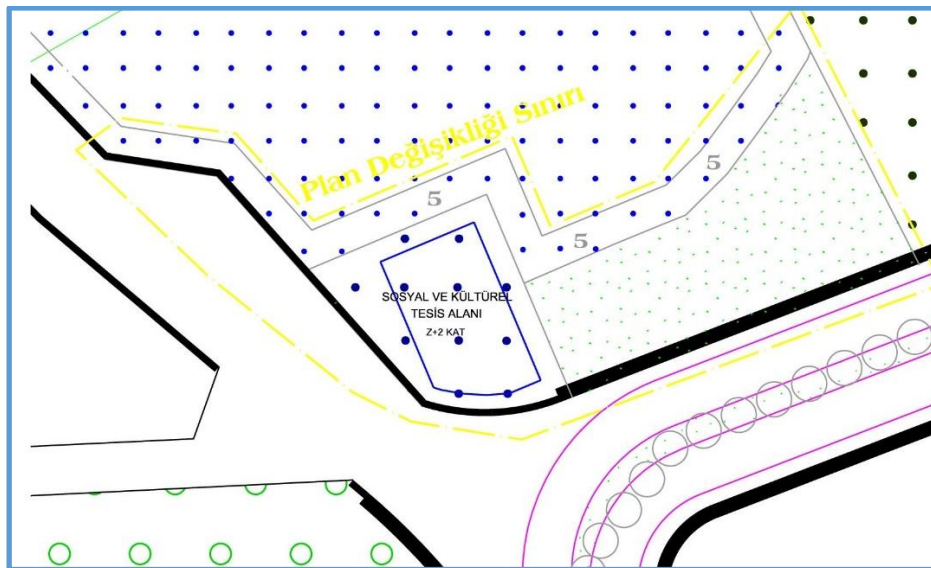
Şekil 4: Öneri 1/1000 Ölçekli Uygulama İmar Planı Değişikliği

Yeniden değerlendirilmesi talep edilen alanda Harita Şube Müdürlüğümüz tarafından yerinde inceleme yapılmış, topoğrafta koşulları ve gerçekleştirilmesi düşünülen Sosyal ve Kültürel Tesis'in yapılaşma mümkünatı ve yakın zamanda gerçekleştirilen imar uygulaması işlemi göz önünde bulundurularak yeni bir plan değişikliği önerisi hazırlanmıştır. Hazırlanan plan değişikliği önerisinde söz konusu alan, Sosyal ve Kültürel Tesis Alanı ve kütle sınırı yeniden tanımlanarak, kısmen Yol Alanı, kısmen de yerinde fiili bulunan park sınırlarına göre Park Alanı'na alınmıştır. Huzurevi Alanı sınırlarında 5 metre çekme mesafeleri belirlenmiştir.